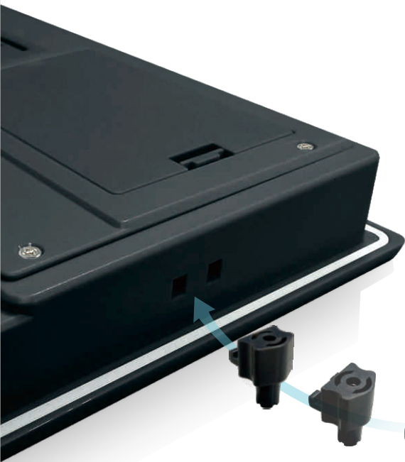
专利型固定Lock (支持机柜板材厚度1~2.5mm)

采用屏通专利型免螺丝固定扣件，无需任何工具即可快速安装，如有更高防护的需求，可选择螺丝型铸铁扣件，将防护等级提升至IP66。